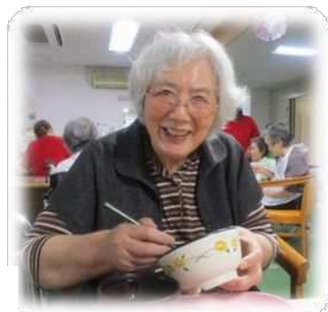
皆さん 美味しそうに食べられていました♪