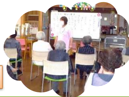
リハビリ、脳トレ、レクリエーション、作業活動等頑張っています