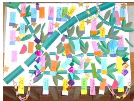
7月の壁画「七夕飾り」