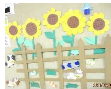
七夕様 願い事を書いて玄関先に飾っています