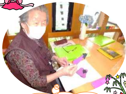
七夕飾り作成中です